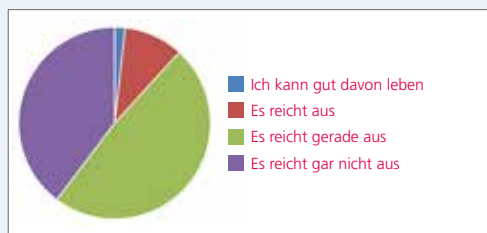
Antworten zum Arbeitseinkommen

Viele von euch haben sich an unserer Tarifbefragung beteiligt und gute Gründe benannt, warum eine deutliche Erhöhung eures Einkommens dringend notwendig ist.